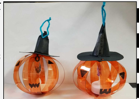
サンプルはスタッフルームに飾ってあります。

★材料の個数把握のために必ず申込みをしてください。申込みが無い場合は、参加できませんのでご了承ください。