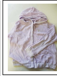
薄紫薄手の パーカー