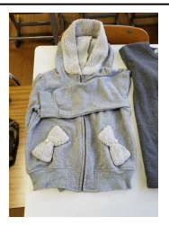
リボン付き グレーパーカー