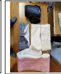
ピンクマフラー・ 水筒カバー