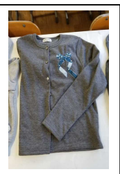
ワッペン付き 青カーディガン