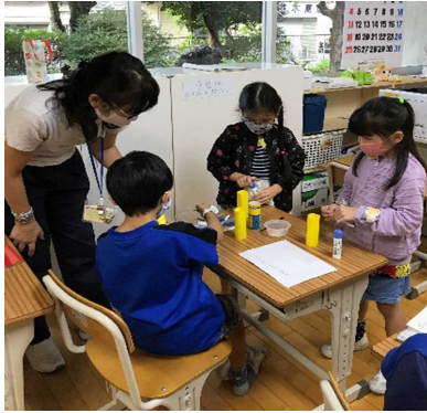
「ミニオンをつくろう！」