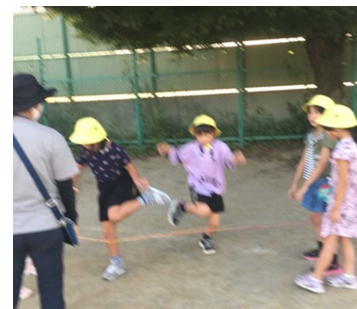
「ゴムダンって、たのしい！」

スタッフから・・・片山小の子どもたちはとても素直で優しく、自分から進んで「こんにちは！」と気持ちの良いあいさつをしてくれる子が多いのには、本当に驚きました。これからも、どんどん声をかけてくださいね！ (A.T)