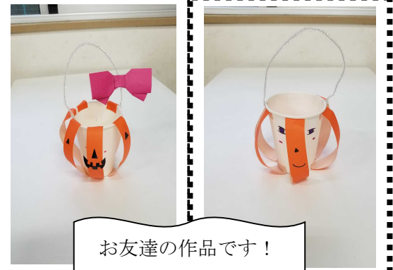
お友達の作品です!