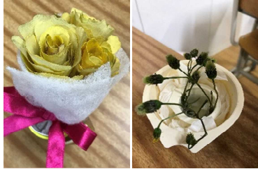
イチヨウの葉などで作ったよ