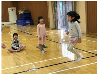
「すご〜い！」 「何回跳んだ？」